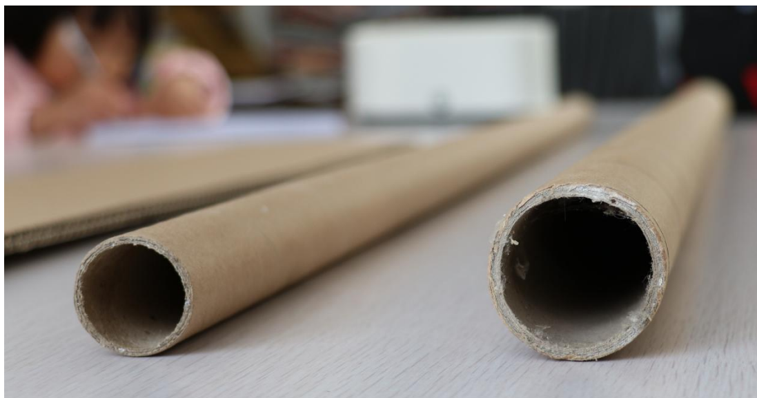
打卷所用的卷筒直径和长度都可定制

采用卷装包装的织物没有转折（折痕）处，不影响织物的弹力；也没有打包包装的折痕。打卷后的成品如图：